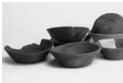
印旛地域から出土した土器

期間 = 1月16日(月)～6月30日(金) 土・日・曜日、祝日を除く) 時間 = 午前9時～午後4時30分 会場 = (財)印旛都市文化財センター考古資料展示室(佐倉市) テーマ = 「ウチの土器、ヨソの土器 古代印旛の須恵器と流通」 内容 = 古代、とくに奈良・平安時代に印旛地域外からもたらされた須恵器と印旛地域周辺で生産された須恵器、さらに須恵器以外にも遠方からもたらされた遺物を展示 入館料 = 無料 くわしくは同センター(☎ 043-484-0126)へ。