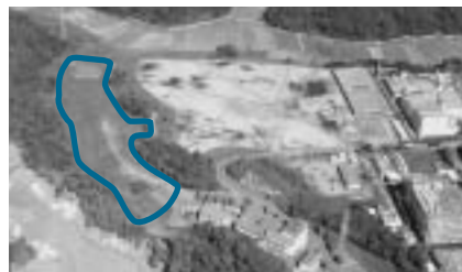
いずみ清掃工場に隣接した建設予定地

県環境影響評価条例に基づき、現在成田市と富里市の共同整備により市内小泉地先に建設を計画している「新清掃工場」の事業計画概要書を縦覧します。 期間 = 1月24日(火)～環境影響評価方法書の縦覧期間の初日の前日(土・日曜日、祝日を除く) 時間 = 午前9時～午後5時 縦覧場所 = 環境計画課(市役所2階) 県環境政策課(県庁本庁舎3階) 内容 = 事業者の名称と代表者の氏名および主たる事務所の所在地、対象事業の名称・目的および内容、対象事業実施区域およびその周囲の概況 くわしくは環境計画課 ☎20-1533 または県環境政策課 ☎043-223-4135 へ。