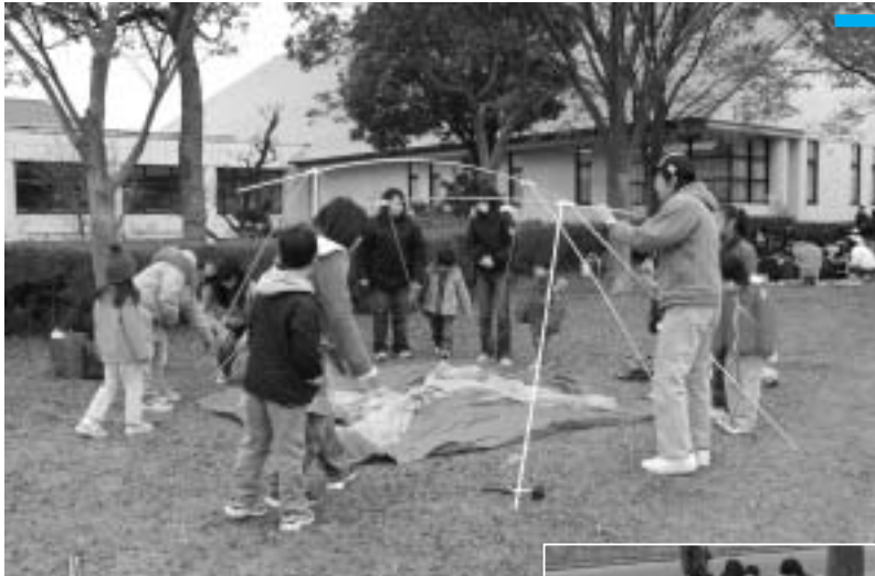
ボーイスカウトの指導で テント張り