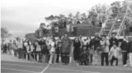
子どもに声援を送る親たち