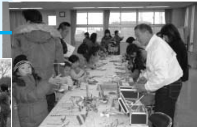
スーパー紙とんぼに挑戦