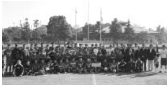
日韓仲良く記念撮影

友好都市・仁川広域市中区(韓国)訪問団のサッカー選手と成田市選抜チームによる親善大会が11月26日、中台競技場において行われました。本市と中区は平成10年からサッカーを通じた民間交流が行われていて、韓国チームの来成は今回で3回目。試合後、選手たちはお互いの健闘をたたえながら仁川での再会を約束していました。