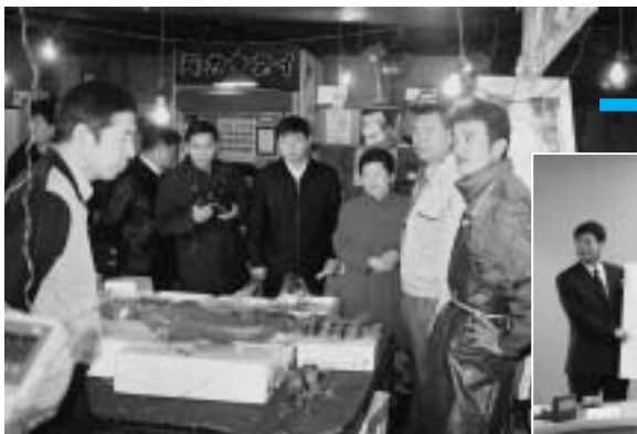
魚の種類の多さにびっくり