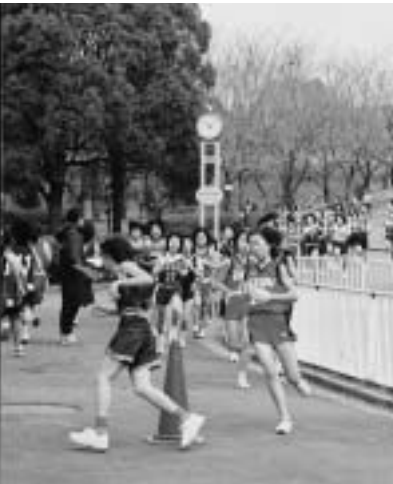
公園内の折り返し地点