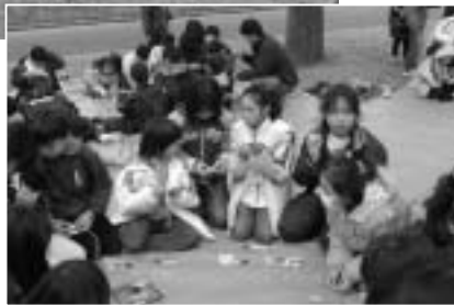
手づくりペンダントを作成