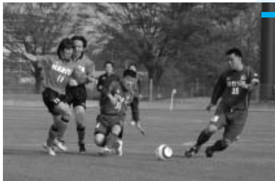
親善試合とはいえプレーは真剣