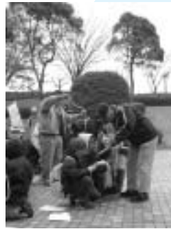
意外に難しい ロープ結び