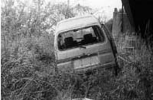
車にも愛情と責任をもって

本年1月1日から自動車リサイクル法がスタートしたことにより自動車所有者には、リサイクル料金の支払い、廃車する際は自治体に登録された引取業者に引き渡すことが義務付けられています。自動車を廃車する場合は、自動車リサイクル法による手続きをし責任をもって処分してください。市では道路などに放置された自動車を見つけたときは、成田市放置自動車の発生の防止及び適正な処理に関する条例により、自動