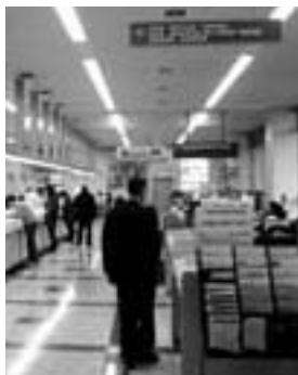
忘れずに手続きを

出できない場合は、代理人による届け出もできますが、委任状が必要となります。異動者の氏名、生年月日、異動日、新・旧住所、新・旧世帯主氏名を確認して届け出てください。