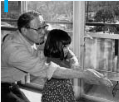
手作りのスーパー紙とんぼ