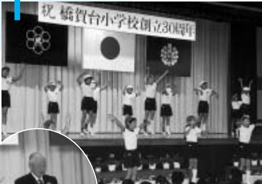
みんなで祝う30周年

橋賀台小学校の創立30周年を記念した式典が、11月20日、同校において保護者のほか多くの来賓を招いて行われました。式では初代校長やPTA会長、卒業生などが開校当時の苦労や懐かしい思い出を披露。式典の後は全校生徒によるダンスや朗読、劇などが行われ30周年を盛大に祝いました。また、同日は神宮寺小学校、前日には玉造中学校でもそれぞれ創立20周年記念式典が行われました。