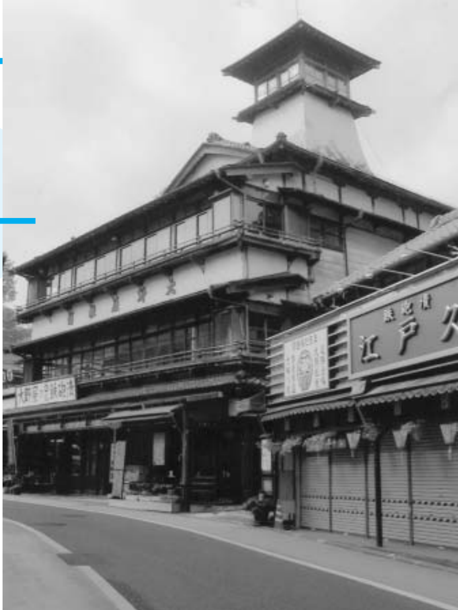
望楼が印象的な大野屋旅館

成田山新勝寺の門前に建つ大野屋旅館が、市内では最初の国の登録文化財に指定されることになりました。登録文化財とは、築後50年を経過し、歴史的景観、再現が容易でないもの、造形の規範となっているなどの基準に当てはまる建造物が登録されるものです。現在の大野屋旅館は昭和10年に建て替えられたもので、114畳敷き大広間には能舞台が設けられ、屋根に望楼がそびえる木造3階建の旅館は、門前の景観の中でも際立った建物です。