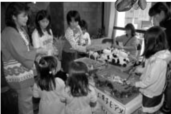
楽しいお菓子すくいはいかが？

12月5日、中央公民館で子ども会まつりが開催されました。未明の暴風でテントが飛んでしまうなどのアクシデントはあったものの、日中は冬とは思えない暖かな晴天に。会場には、竹とんぼなどの昔のおもちゃを作るコーナーや懐かしいベーゴマ体験コーナーが設けられ、多くの子どもたちでにぎわいました。