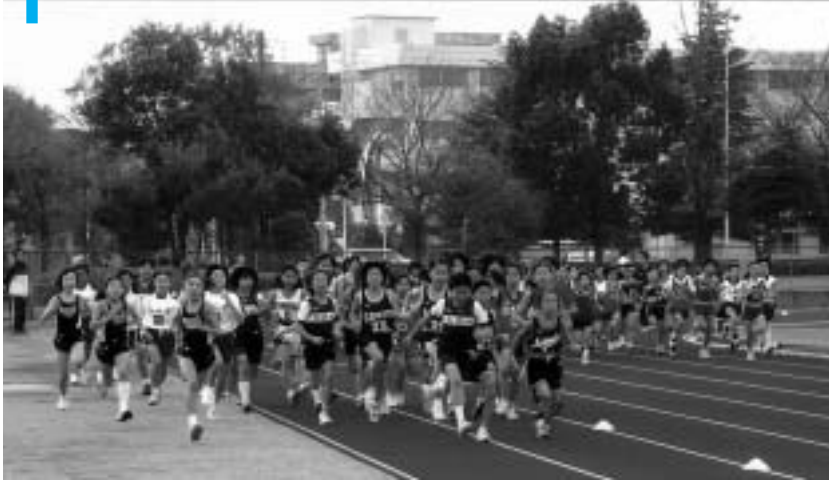
記録を目指し一斉にスタート（小学5年生女子の部）

前日までの強風が収まり、絶好のロードレース日和となった12月7日、小学5年生から中学2年生までの男女約500人のランナーが、陸上競技場を発着点に、中台運動公園特設コースを駆け抜けました。大会記録の更新こそならなかったものの、各部門とも好記録が続出しました。部門ごとの優勝者は次のとおりです。