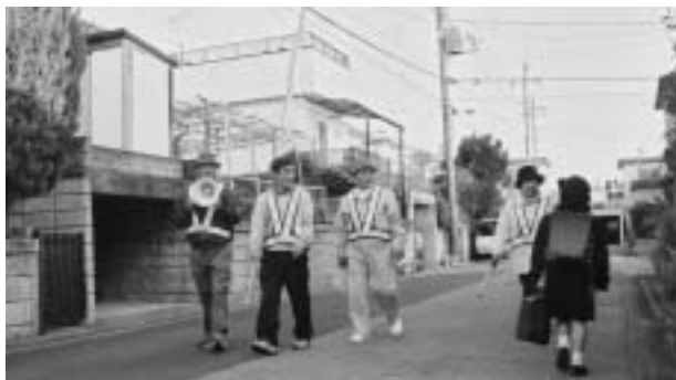
声を掛けながらのパトロールが大切（橋賀台地区）

わたしたちにとって身近な犯罪 空き巣、車上狙い、自転車・オ ートバイ盗などが増加していま す。市の犯罪発生件数は、平成7