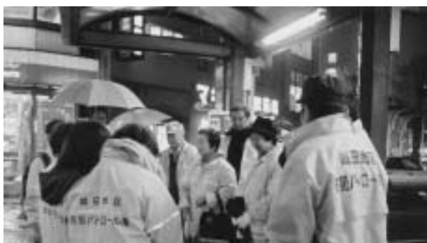
パトロール前のミーティング（成田地区）

年1,995件に対し、14年には 3,700件と1.8倍に増加。中 でも空き巣、車上狙い、自転車盗 などの窃盗が総犯罪数の約83%を 占めています（5ページグラフ1参 照）。地域の安全は、警察や行政に 任せているだけでなく市や自治