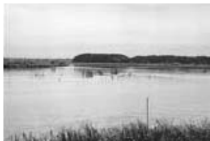
豊かな水辺を守るために

応募方法 = 6月18日(金)までに、申請書類(同基金窓口で配布)に必要事項を記入のうえ、直接または郵送で同基金(〒285-0016 佐倉市宮小路町12)へ くわしくは(財)印旛沼環境基金(☎043-485-0397)へ。