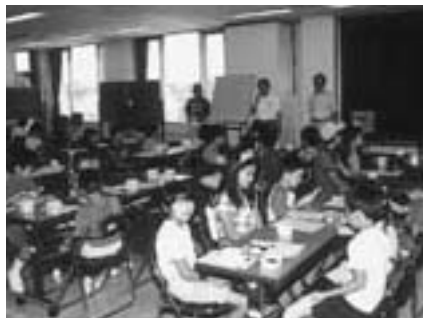
地域のサークルの人が指導してくれます

申し込みは午前9時から直接または電 話で玉造公民館(☎26-3644・月曜日、 祝日は休館)へ。