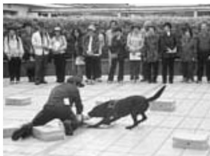
麻薬探知犬の訓練も見学