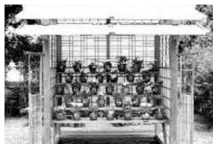
サクラソウのひな壇飾り

月曜日は休園です。くわしくはハローダイヤル(☎03-5777-8600)または「れきはくホームページ」( http://www.rekihaku.ac.jp/ )へ。