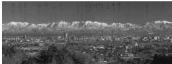
生家の裏山からは美しい立山連峰が