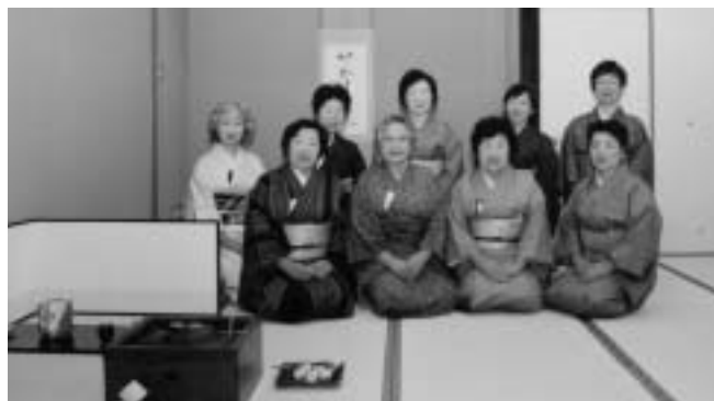
幸せを感じるひとときを