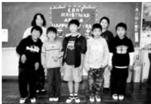
楽しみながら英語が覚えられますよ！

人にはシールがもらえました。また、絵のカードを5枚置いて、前の人と言ったのは別の単語を順番に答えていくゲームもやりとても楽しかったです。