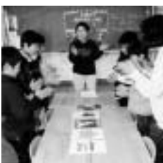
次はどの絵を言おうかな

人にはシールがもらえました。また、絵のカードを5枚置いて、前の人と言ったのは別の単語を順番に答えていくゲームもやりとても楽しかったです。