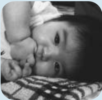
こんにちは 赤ちゃん 88