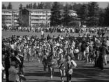
ゴール目指して元気にスタート