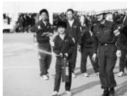
万が一に備えて真剣に

災害から市民や地域の安全を確保するため、市内を震源地とする直下型地震を想定した総合防災訓練を実施します。 訓練当日は、サイレンが鳴ったり、赤色灯が点滅したりしますが、火災などとまちがえないように注意してください。 日時 = 11月13日(木) 午後2時～3時(荒天中止) 会場 = 千葉県住宅供給公社用地内(玉造) くわしくは総務課防災対策室 ☎20-1510)。