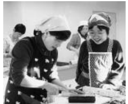
どんな形ができたかしら

期日 = 第1回...11月18日(火) 第2回...11月26日(水) 第3回...12月2日(火) 時間 = 午前9時30分～午後2時 会場 = 中央公民館調理室 第3回は遠山公民館調理室) 内容 = 太巻き寿司の作り方を学ぶ(3回とも同じ内容です) 対象 = 市内在住または在勤の成人初心者 定員 = 各20人(応募者多数は抽選) 参加費 = 1,000円程度(材料費) 申し込み方法 = 11月7日(金) までに、ハガキに住所・氏名・電話番号を書いて農政課 ☎ 286-8585 花崎町760 へ くわしくは同課 ☎ 20-1541 へ。