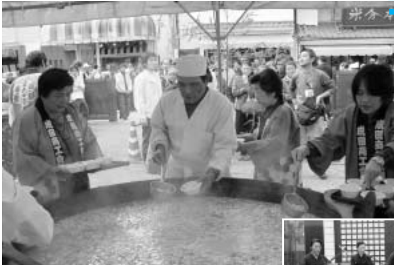
大鍋の振る舞いには長い行列が

こととして第9回を迎えた「御利生祭」が、10月18日・19日の両日、表参道周辺で開催されました。昨年までの時代絵巻から、大鍋・弦まつりに内容を一新。琴や胡弓の音色が流れる参道には、直径1.5mの五穀豊穡鍋も登場。また、夜には参道にろうそくが灯され、幻想的な「千灯路」は訪れた人々を魅了しました。