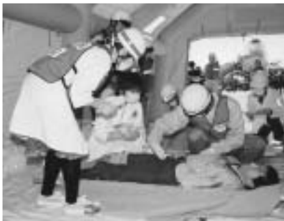
医療チームが負傷の程度を素早く判断