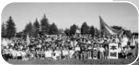
王座に振り返り咲いた本城小学校区