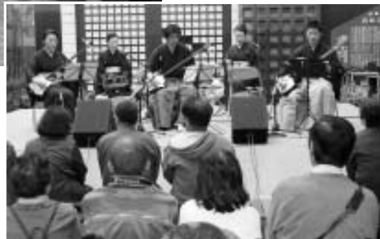
参道に響きわたる三味線の音色