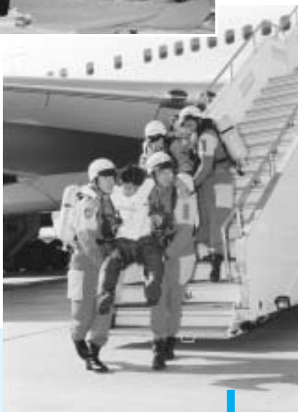
事故機から負傷者を救出する救急隊