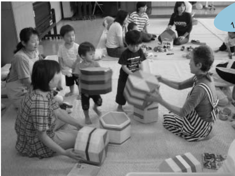
子どもたちの明るい未来のために

衆議院議員総選挙の投票と最高裁判所裁判官の国民審査が、11月9日(日)の午前7時から午後8時まで行われます。衆議院議員は、小選挙区と比例代表の二つの選挙によって選ばれます。当日、仕事やレジャーなどで投票のできない人は、不在者投票ができます。有権者のみなさんは、貴重な一票を棄権せず、必ず投票しましょう。