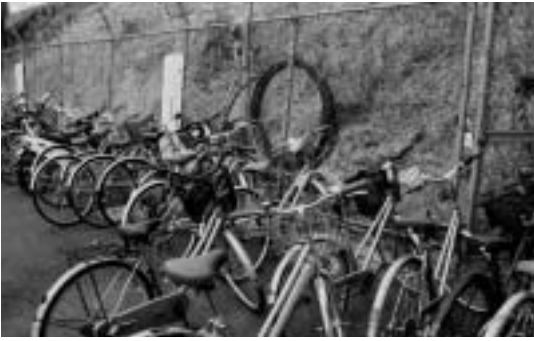
放置自転車は通行の妨げです