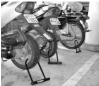
鍵掛けで盗難防止を