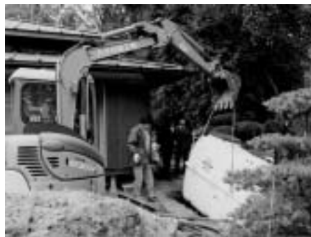
補助金を利用し快適に