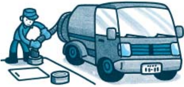
合併処理浄化槽の補助金

市では、合併処理浄化槽の維持管理(保守点検・清掃)に年間要した費用の2分の1相当額(左表)