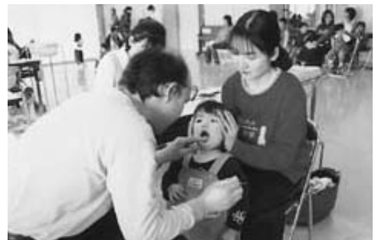
きれいに磨けているね