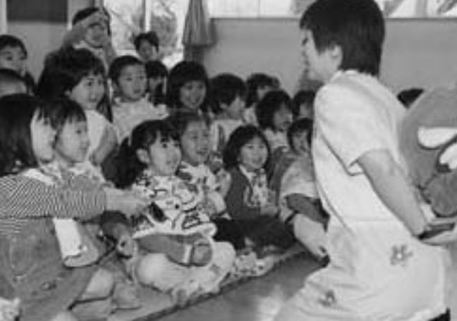
保育園での歯磨き指導