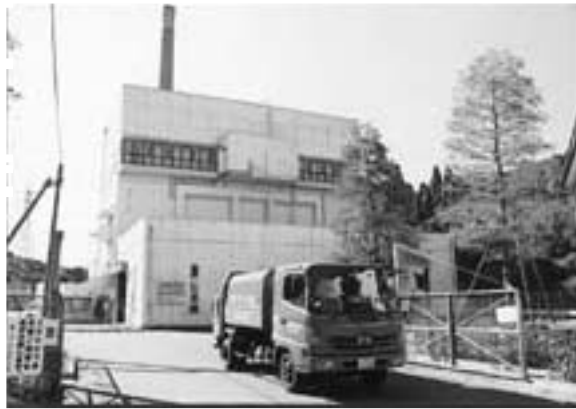
収集日や収集方法を確認しましょう

年末から年始にかけて、ごみの収集日などが変更になります。年末は大掃除や新年に向けた準備などで、ごみの排出が増える時期です。市民のみなさんも、収集日や収集方法を確認の上、ごみの排出の抑制・再資源化・再利用にご協力をお願いします。