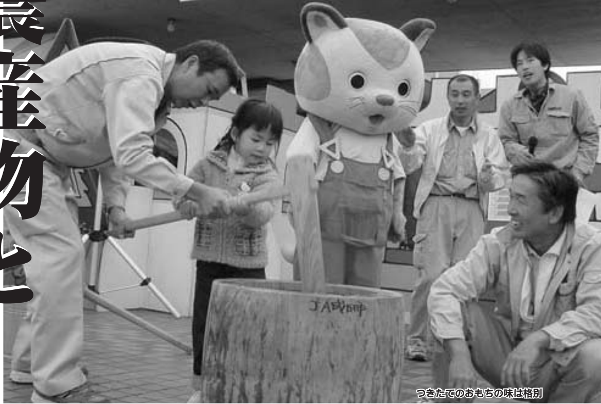
つきたてのおもちの味は格別

実りの秋に、丹精込めて作られた農産物が勢ぞろいする恒例の「産業まつり」。ことしも11月16日(土)と17日(日)の2日間、国際文化会館で、農産物共進会・商工観光展・即売会などが開催されます。家族そろって足を運んでみてはいかがでしょうか。