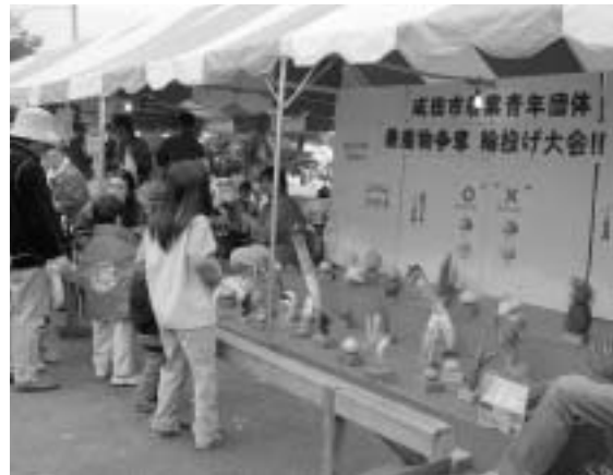
狙いはマスクメロン!?