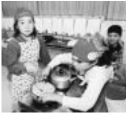
あーん、失敗しちゃったよ

失敗の原因は、やはり分量をまちがえたこと、精粉を一気に入れ過ぎたこと。実験に失敗は付き物ですが、おいしい手作りコンニャクを食べられると思ったのに少し残念です。でも、これにめげず次回もコンニャク作りに再挑戦しようと思いま