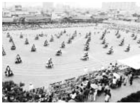
稲葉地小学校の大運動会