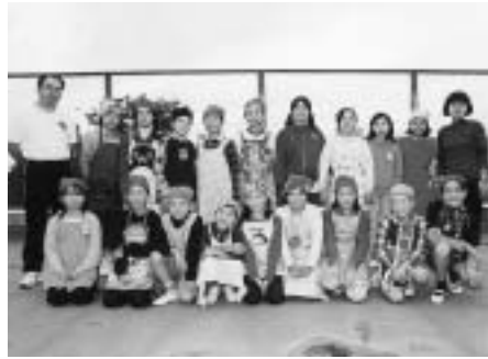
この中からノーベル賞受賞者が出るかも？