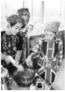
精粉を入れながらよくかき混ぜる

先生の説明の後、さっそく実験開始。ぬるま湯を入れたなべに、精粉(コンニャク芋を粉末にしたもの)を少しずつ混ぜながらかき回します。これを火にかけて、のり状になるまでよく混ぜるのですが、火にかける前にすでに固まって、玉になってしまいました。どうやら、ぬるま湯と精粉の分量をまちがえたよう。先生の指示で、すぐにぬるま湯を足しましたが、いくらかき混ぜても、一度固まったコンニャクのもとのは