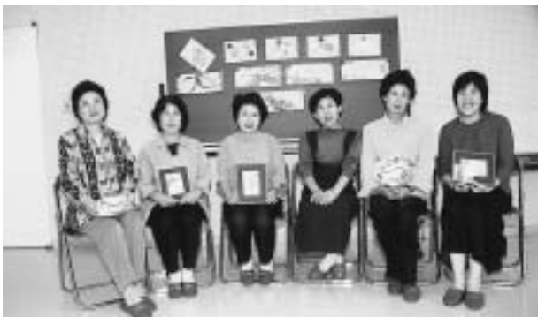
心を込めた作品を手に

8日から行われる公民館まつりに初めてわたしたちの作品を展示します。丹精込めて描いたものばかりです。ぜひ見に来てください。