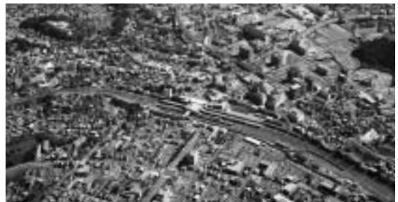
「住んでいてよかった」「ずっと住み続けたい」まちに

県では都市計画法の改正により、すべての都市計画区域で整備・開発および保全の方針を定める「都市計画区域マスタープラン」を、平成16年5月を目標に策定することになりました。