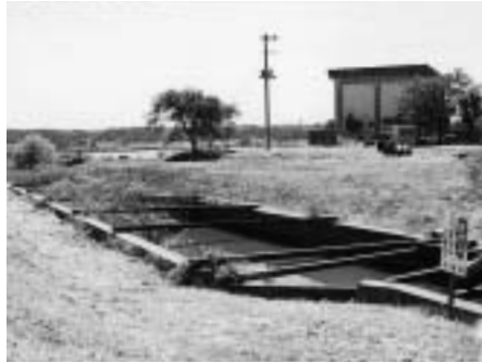
落ちたら危険!遊ばないで