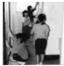
みんなきれいに使ってね

委員会の目標は、「一生懸命活動しよう」。病気になる人がいない元気な学校を目指してがんばります。もし具合が悪くなったら、わたしたちに声を掛けてください。一生懸命お世話しますよ。