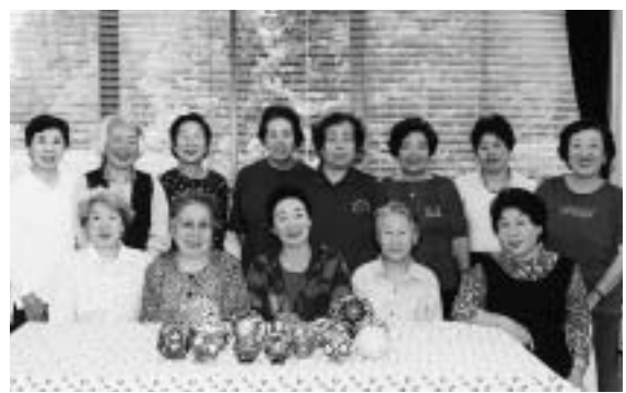
まりづくりに熱中しています

手まりの模様は幾何学・草花・動物などさまざまで、色とりどりの糸でかがるおもしろさは無限で、糸の種類を変えるだけで不思議と美しさや優しさが表現できます。また、季節感のある情景を描くことで、心を和ませてくれます。