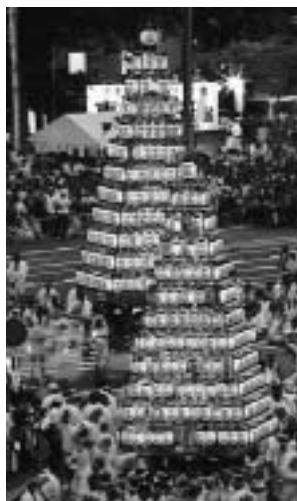
夜の提灯大山笠は圧巻

18歳で上京し、成田に住みはじめたときは、空気がとてもおいしかったのを覚えています。私は海釣りが趣味で月に何度か出かけます。南房総には道の駅が7カ所もあり、食事、みやげ、トイレなどに大変重宝しています。観光客のために成田にもぜひ欲しいですね。