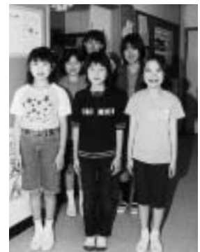
明るく元気な保健委員会