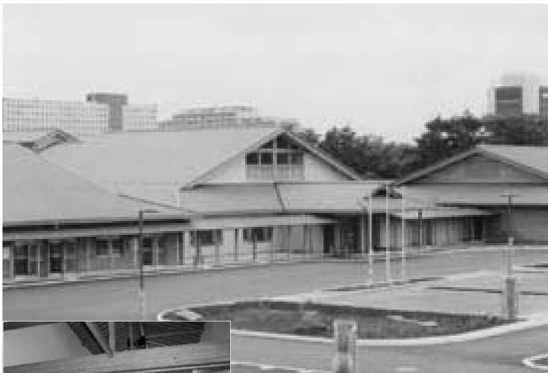
落ち着いた外観と木の温もりが 感じられる館内