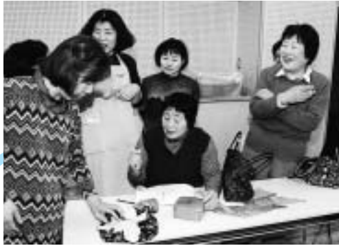
素敵なティッシュボックスができたわね