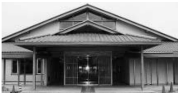
完成間近の保健福祉館（写真は正面玄関部分）

保健福祉館に関する問い合わせは、保健福祉計画課（☎20-1535）へ。また、各種業務については、上表各担当へ。