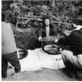
補助金を利用して設置を

市では、合併処理浄化槽を設置する人に、下表のとおり設置にかかる費用の一部を補助しています。また、浄化槽の設置に伴い、トイレを水洗化した場合、水洗便所設置補助金（3万円を限度）が支給されます。また、浄化槽を設置した人は、浄化槽が正常に機能