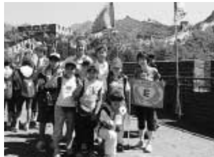
万里の長城だって私たちにおまかせ

応募方法 = 履歴書に写真を張って郵送で (社)成田青年会議所事務局(☎286- 0026 本町342)へ くわしくは同事務局(☎23-1900)へ。