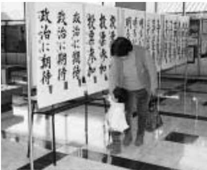
おばあちゃん、何て書いてあるの？

市選挙管理委員会では、選挙啓発書初め展の作品を次のとおり募集します。 課題 = 小学1年生「あす」、2年生「きぼう」、3年生「白ばら」、4年生「わかい力」、5年生「新しい力」、6年生「私の一票」、中学1年生「輝く未来」、2年生「明るい選挙」、3年生「政治に参加」 応募方法 = 書初め用紙(縦83cm×横21cm)に、課題と氏名(小学1・2年生は名前だけでも可)を書き、作品の左下に名札(学校名・学年・氏名を記入)を張り、学校ごとにまとめて1月15日(火)までに市選挙管理委員会 市役所4階へ くわしくは同委員会 ☎20-1510 へ。