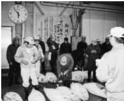
威勢のいい掛け声が飛び交う初せり