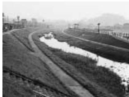
水辺は心安らく散歩道