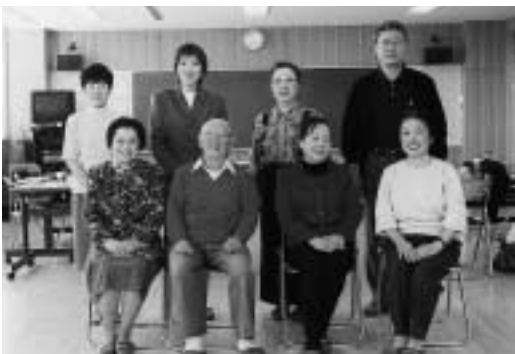
普段どおりの力を出せば、公演もバッチリ!!