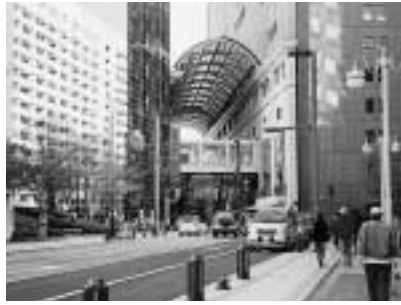
にぎわう天神西通り付近

いる家族が集まり、にぎやかに食べるお雑煮の味は忘れられません。また、100年以上の古い糠床 ぬかどこ を分けてもらい、毎日欠かさずぬか漬けを食べていました。自慢の糠床でしたが、成田に来てためにしてしまっただけが残念です。