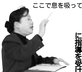
ここで息を吸って