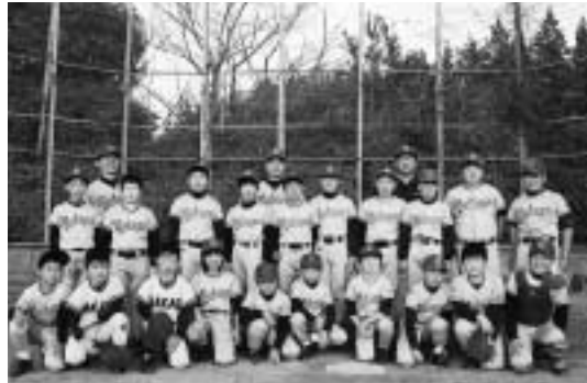
チーム一丸となって念願の勝利を

まで集中力を切らさな”遊びのときのように試合でももっと積極的に目立ってみる”と言います。それが出来なければいつまでも勝てないぞと。