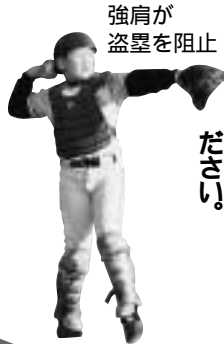
強肩が盗塁を阻止

ぼくたちのことし第一の目標は、春の市の大会で初戦を突破することです。集中力と全員の野球でぜひ勝ちたいと思います。応援してください。