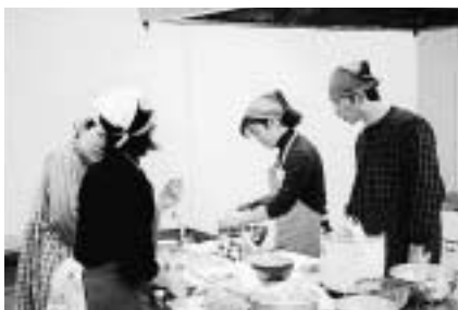
パパも離乳食作ってみよう