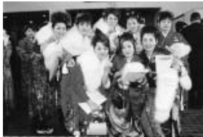
一生に一度きりだもの