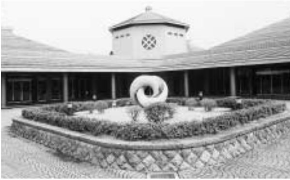
八富成田斎場の使用料