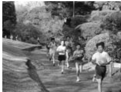
寒風の成田山公園を駆け抜ける

日時 = 12月23日(祝) 午前8時30分受け付け(雨天決行) 受付場所 = 国際文化会館 コース = 成田山公園内特設コース 種目 = 中学生・高校生・一般の男女 参加費 = 一般...1,000円、高校生...500円、中学生...300円(当日受付で) 申し込みは12月10日(月)までに、市体育協会事務局(生涯スポーツ課・☎20-1584)へ。