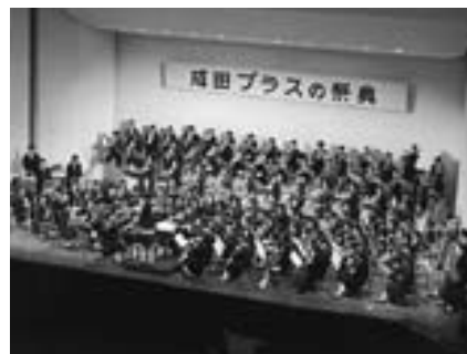
吹奏楽の魅力を満喫してください