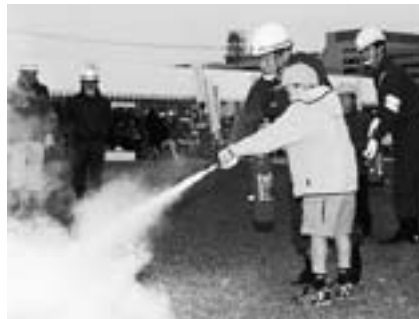
もしものときははばくだって

災害から市民や地域の安全を確保するため、市内を震源域とする直下型地震を想定した総合防災訓練を実施します。訓練当日はサイレンが鳴ったり、赤色灯が点滅したりしますが、火災などと間違えないように注意してください。 日時 = 11月22日(木) 午後1時30分 ~ 3時 (荒天中止) 会場 = 三里塚小学校グラウンド くわしくは総務課防災対策室(☎20-1510)へ。