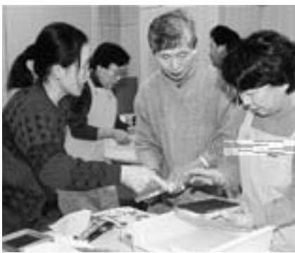
上手にすかないとむらになりますよ

日時 = 12月9日(日)午後1時~3時 会場 = リサイクルプラザ2階学習室 内容 = 牛乳パックを利用した紙すき 定員 = 10人(先着順) タオル2枚・すきこみ用の押し花・押 し葉・千代紙などを用意してくださ い。申し込みなどくわしくは同プラザ (☎36-1000・月曜日、祝日は休館)へ。