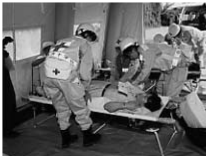
事故に備えて真剣に行われる訓練