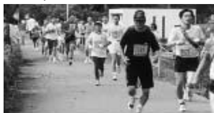
秋の成田を走ってみませんか