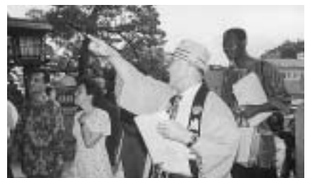
外国の人を案内することも