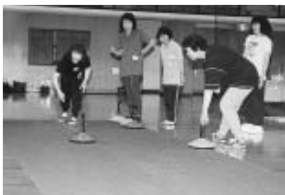
目標にストーンを滑らせるユニカール