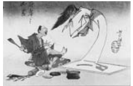
錦絵「応挙の幽霊」(国立歴史民俗博物館蔵)