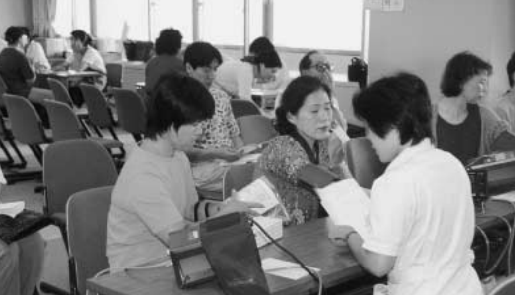
日ごろの健康づくりに役立てて