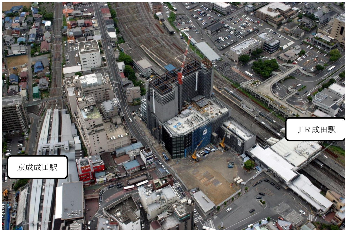
（平成 26 年 5 月 2 1 日 撮影 敷地北側から）

また、並木町土屋線側の立体歩行者通路（1期）工事にも着手し、柱脚下部の杭打工事を行っています。なお、駅前広場工事は、民間立体駐車場などの解体工事が完了し、駅前広場拡張用地が確保されました。今後の駅前広場整備は、並木町土屋線側から工事に着手します。