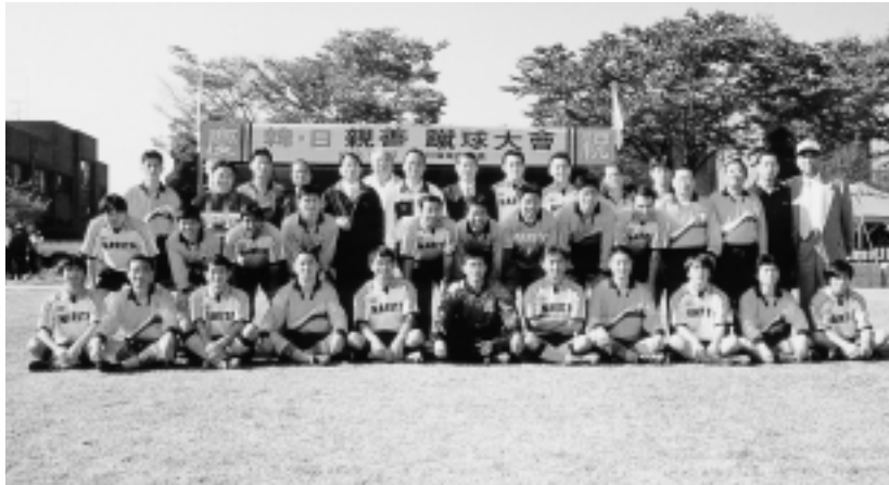
活発な国際スポーツ交流