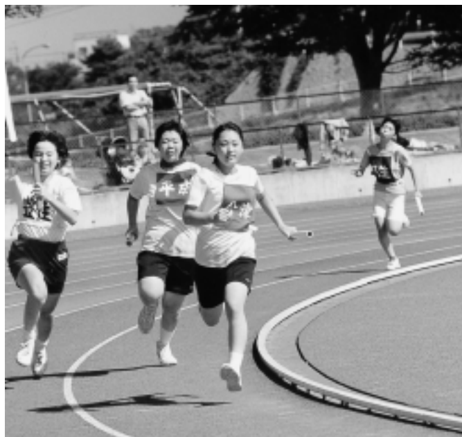
市民運動会・地区対抗リレー

ニュースポーツや自然体験など、子どもから高齢者までの多世代がともに参加できるイベントを開催し、スポーツを通じた世代間の交流を促進します。