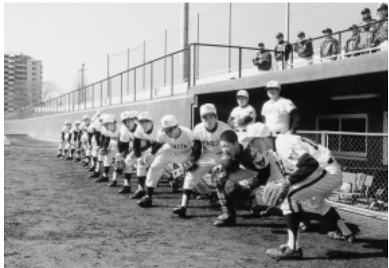
スポーツで楽しむ市民