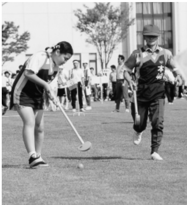
一緒に楽しむ子どもと高齢者

スポーツを行ったり、応援や見学したり、あるいはその他さまざまな目的でスポーツに関わる人々が、ともに会話を楽しんだりできるように、市内の主要なスポーツ施設に交流の場を確保します。