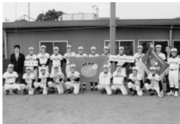
全国中学軟式野球大会で優勝した成田選抜