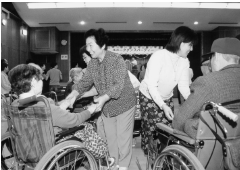
様々なスポーツ交流

市内で開催されるスポーツ大会や他県のチームとの相互交流などに際して，選手や関係者のホームステイを積極的に受け入れ，スポーツイベントを通じたさまざまな交流を促進します。