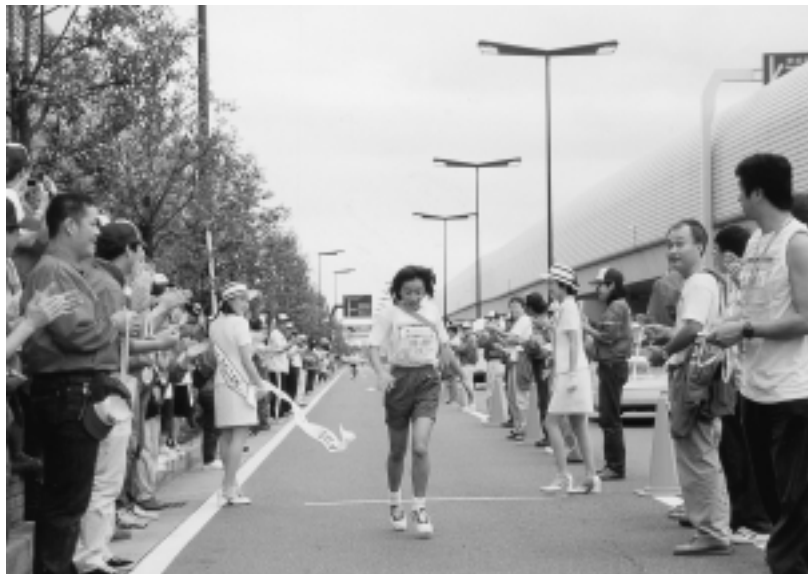
駅伝大会を支えるボランティア

スポーツを支援する活動を促進するため，指導者・ボランティアに関する情報を提供するシステムを構築します。