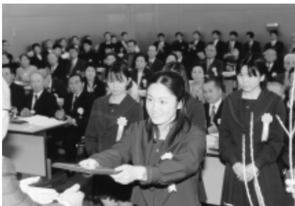
表彰を受ける優秀選手

永年にわたって、市内の選手やチームの育成に尽力した指導者、あるいは、スポーツ活動をサポートしたボランティアを対象として、独自の表彰を行います。