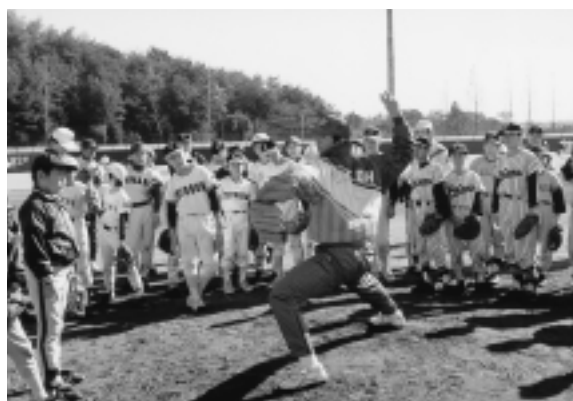
一流選手の指導を受ける子どもたち