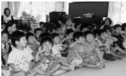
きれいに磨けたかな