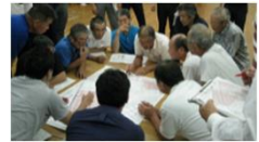
将来の目標地図例