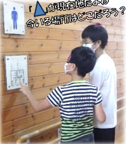
館内に設置されている触地図を体験