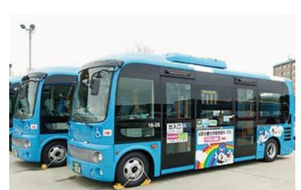
コミュニティバス

労働条件の基準を順守するため、連続運転4時間につき30分以上の休憩時間を確保するとのことでした。市民サービスへの影響が最小限となるよう運行受託者と調整を行い、地域公共交通会議での協議を経て、令和6年4月1日より改正後のダイヤによる運行を開始する予定とのことでした。