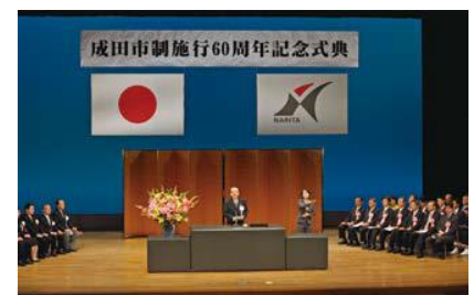
市制60周年で開催された記念式典

響楽団によるコンサートや成田山車まつりのほか、友好都市や姉妹都市から関係者を招待し記念式典を開催する等、さまざまな記念事業の実施に向けて検討を進めているとのことでした。