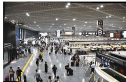
令和5年9月時点の成田空港

(注5)地域未来投資促進法……地域の特性を活用した事業の生み出す経済的効果に着目し、これを最大化しようとする地方公共団体の取り組みを支援する法律。