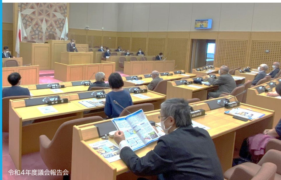
令和4年度議会報告会