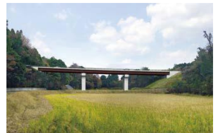
橋梁の完成イメージ図

期を考慮し、橋桁などを設置する上部工事を実施した上で、令和7年度中に橋梁全体の完成を目指しています。