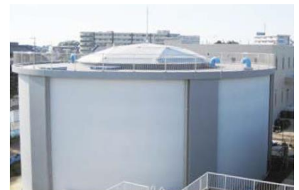
改修中の並木町配水場

器の試運転調整などを行っているとのことでした。今後、消毒設備工事などを令和5年第3四半期に予定しており、令和6年度中の完成を目指して工事を進めていくとのことでした。