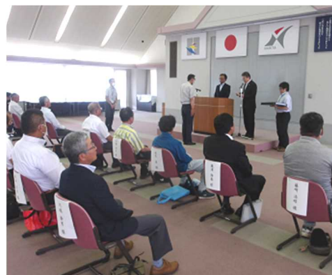
会長から推進委員に委嘱状を交付