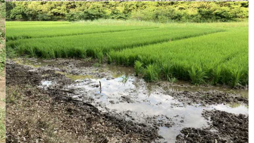
イノシシが荒らした田んぼ