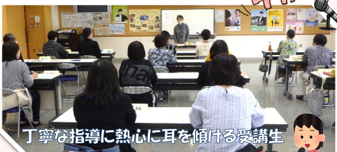
丁寧な指導に熱心に耳を傾ける受講生

5月～7月、音訳ボランティアの初級講座(全6回)が開催され、21名の方が受講されました。