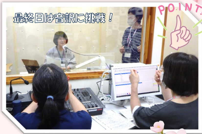
最終日は音訳に挑戦!

音訳グループ「さくら草」は、社会福祉協議会ボランティアセンターに所属するボランティアグループです。成田市の障がい者福祉課からの依頼により、「広報なりた・議会だより」の音訳(音声版の制作)をしています。視覚障がい者の方の福祉向上に寄与することを目的に情報を発信する活動を行っています。今回の講座終了後に10名の方が「さくら草」の仲間に加わるようになりました。これから一緒に活動していくのが楽しみです!