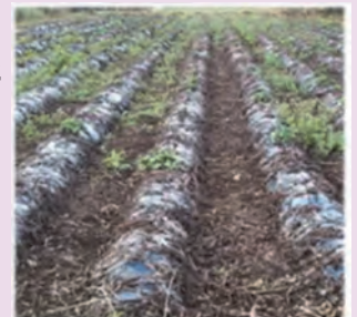
被害を受けたサツマイモ畑(他県の例)