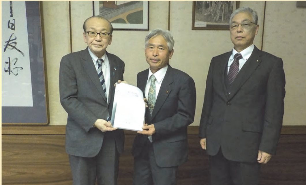
左から、小泉市長、檜垣会長、秋山職務代理者

令和5年2月9日、成田市農業委員会では農業委員会等に関する法律第38条第1項の規定に基づき、「農地等利用最適化推進施策に関する意見書」を市長に提出しました。