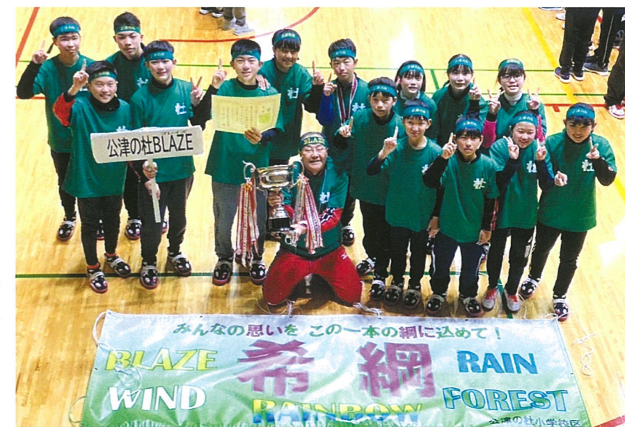
1 優勝チーム 公津の杜小学校「公津の杜BLAZE」

コロナ対策の為、規模を例年の半分以下に縮小しての開催ではありましたが、市内の小学校及び義務教育学校20学区より40チームの出場があり、監督・マネージャー・選手あわせて646名が参加し、どのチームも練習の成果を発揮すべく、全力の戦いが繰り広げられました。