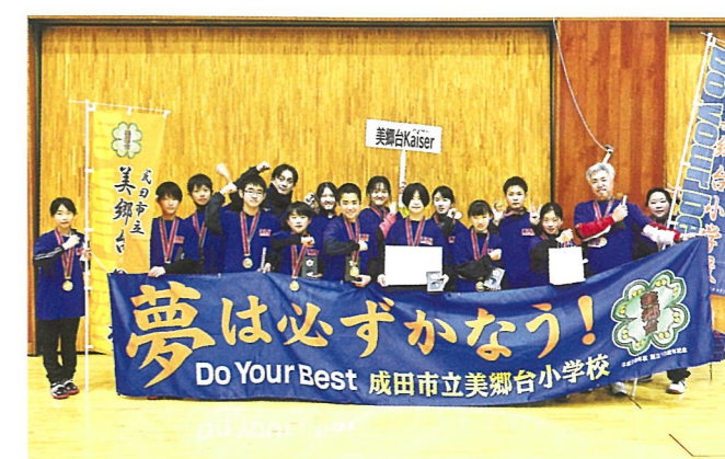
3 第3位チーム 美郷台小学校「美郷台Kaiser」