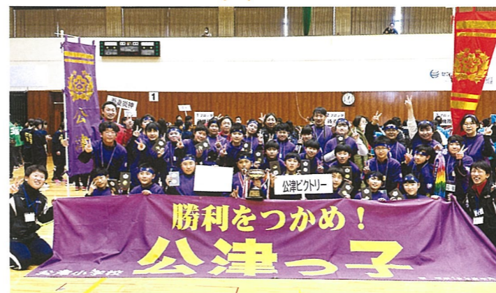
2 準優勝チーム 公津小学校「公津ビクトリー」