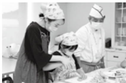
出来上がりをイメージしながら

※申し込みは1月5日(木)から同センター(☎40-4880、1月9日を除く月曜日、1月10日(火)は休館)へ。