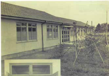
開設当時の当院 (昭和23年)

その後、昭和29年に現在地へ移転し、令和5年2月1日をもって75周年を迎えます。