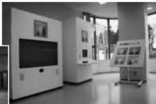
署内には防火学習コーナーも