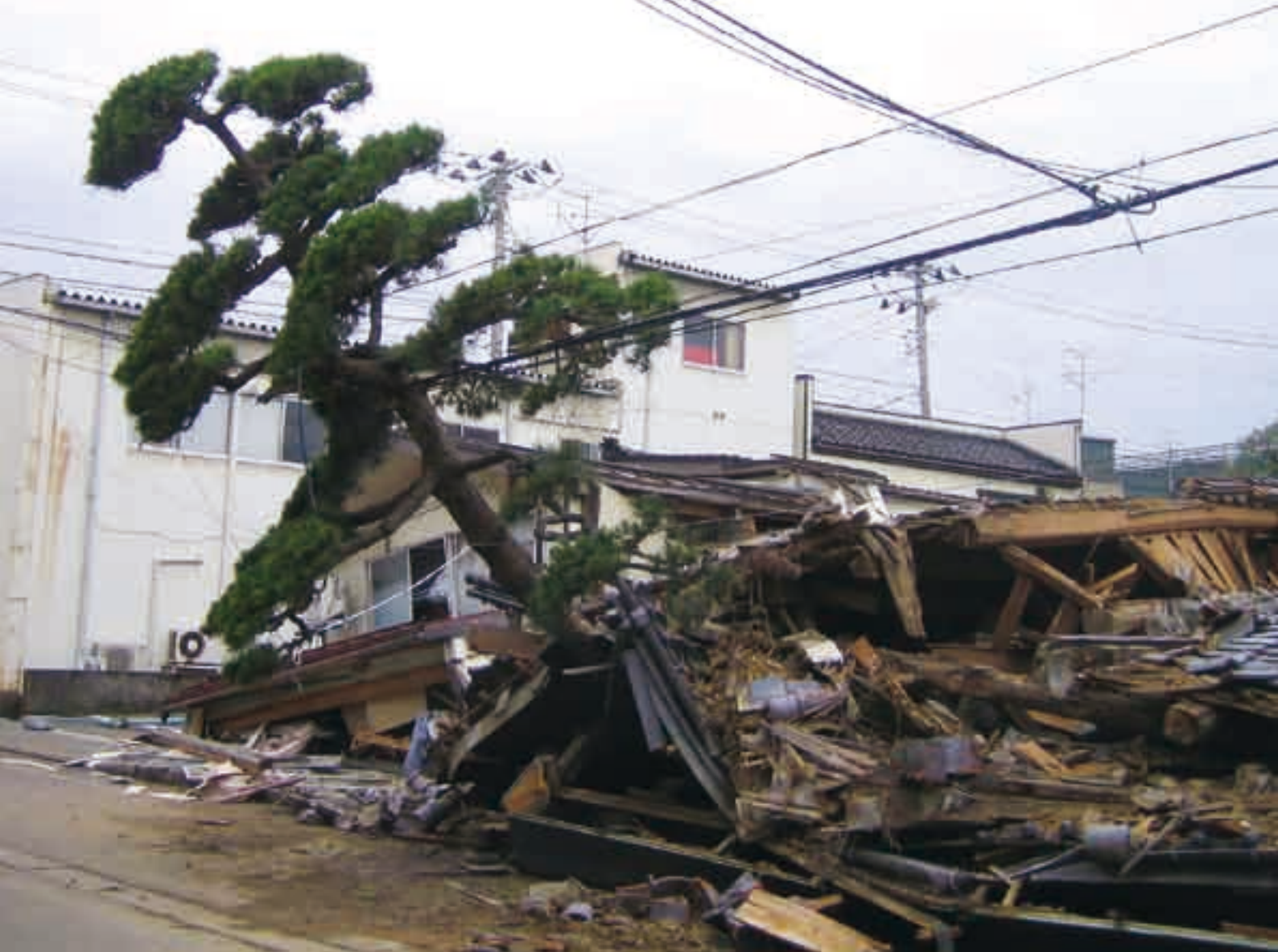
新潟県中越沖地震で倒壊した家屋(平成19年7月)