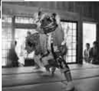
力強い幣束 へいまく の舞い (11日・西大須賀の神楽)