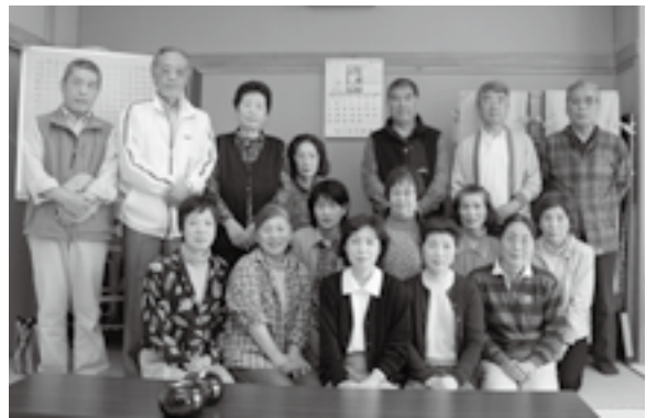
一緒に楽しみませんか