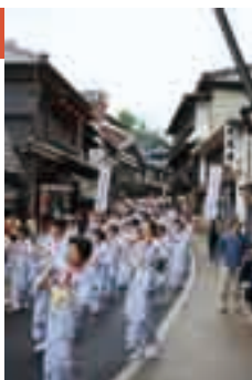
優雅な舞いをご覧あれ

コース=JR成田駅前~表参道~成田山大本堂~平和大塔 ※くわしくは(社)成田市観光協会(☎22-2102)へ。