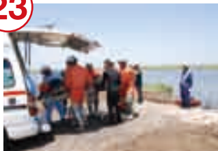
実際の事故を想定して