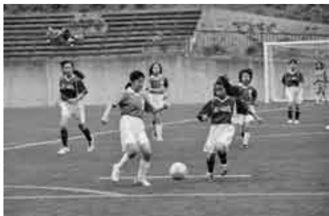
激しくボールを奪い合う