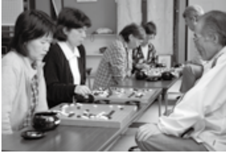
初心者にも丁寧に教えてくれます

女性対象の囲碁教室から始まり、サークルとして発足してから約6年がたちました。初めのうちは、9路盤や13路盤といって、一般的な19路盤より小さい盤で練習しました。「9、13、19」という数字は、縦横に走る線のこと。線の多い盤は初心者が扱うには難しいので、小さい盤が練習用によく使われるんです。