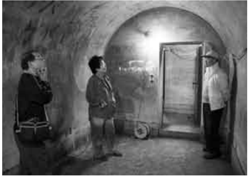
防空壕の主室。広さは11㎡ほど

皇室用として造られたといわれる、三里塚記念公園内の防空壕が4月5日、初めて一般向けに公開されました。同じく公園内にある貴賓館の一般開放に合わせ、この日限定で行われたもので、「三里塚の歴史を伝承する会」の呼び掛けによるもの。訪れた人たちは、地下5mに広がる謎めいた空間に足を踏み入れると、その堅固な構造に口々に驚きの声を上げていました。市では、引き続き一般公開に向けた調査・整備を行っていくこととしています。