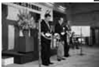
開署式でのテープカット

急増する救急要請などに対応するため、江弁須地先に建設された赤坂消防署公津分署。その開署式が3月24日に行われました。同分署が管轄するのは公津の杜、台方、飯仲地区など。地域防災の重要な拠点として、4月1日から運用が開始されています。