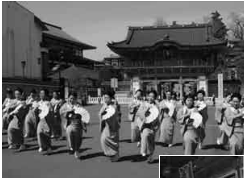
幸町・女人講が華やかに(3日・成田のおどり花見)