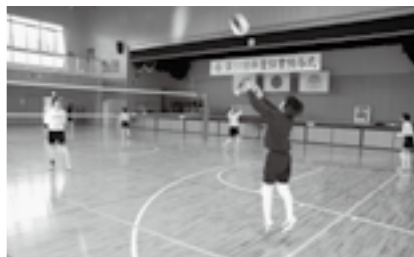
レシーブからアタック への正確なボール回し を意識して

部長(3年生) 試合での勝利に貢献できる よう、チャンスを生かせる アタッカーを目指してい たいです