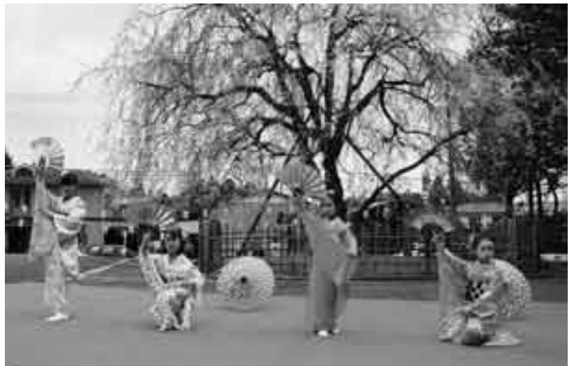
ちびっこ踊り手たちの可憐な舞い

毎年恒例の「しだれ桜ふれあいまつり」が4月4日・5日、公津公民館で行われました。訪れた人たちがまず目を奪われるのが、入り口にある見事な「しだれ桜」。それを背景に行われる華やかな「サークル発表」の数々。「花」と「華」の共演に、観客はうっとり見とれていました。