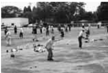
コツがあるんです