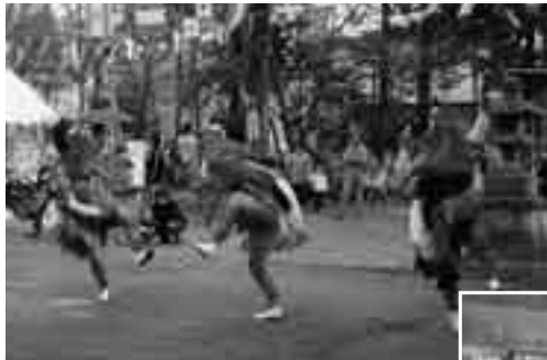
三匹の獅子が縦横無尽に (5日・北羽鳥香取神社獅子舞)

指定無形民俗文化財の奉納が4月上旬、市内各地域で行われました。華やかで力強い舞いは、桜の開花とともに春の訪れを告げる成田の風物詩。伝統の息吹を今も変わらず感じることができます。