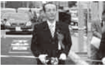
スマートインターチェンジ開通を喜ぶ小泉市長