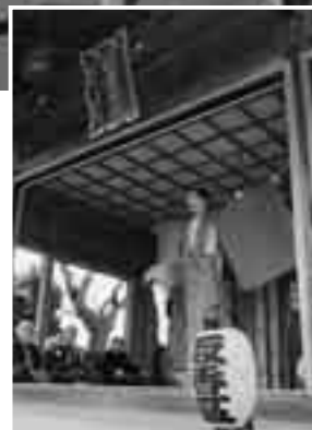
幽玄の美を表現 (5日・取香の三番叟)