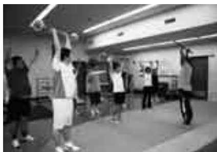
腹筋・背筋の強化を