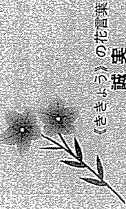
〈ききょう〉の花言葉 誠実