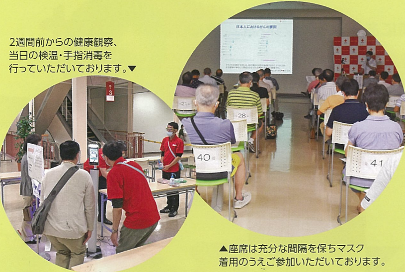
2週間前からの健康観察、当日の検温・手指消毒を行っていただいております。▼

現在は新型コロナウイルス感染症対策として、定員を収容人数の50%程度とし、入場者の体温測定や手指消毒、会場内のこまめな換気などを行い開催しています。皆さまのご参加をお待ちしております。