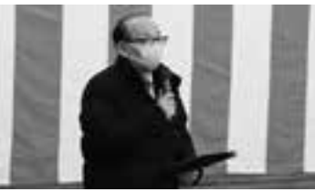
初市式であいさつ(5日)

住んでいる地域で下水道を利用できるようになったときは、トイレや風呂、台所などの汚水を下水道に流すため、各家庭で排水設備の設置が必要です。