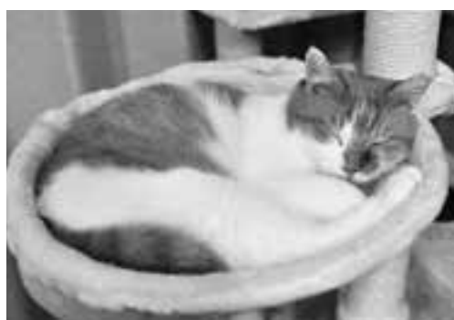
愛情を持って育ててね