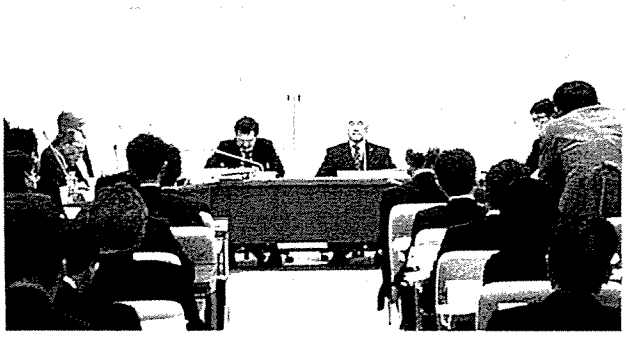
委員長として委員会のかじ取り役を務めました

その提案を受け、議会に予算特別委員会が設置されました。委員会は、3月10日から12日までの3日間行われ、政策内容や併せて、予算の執行過程のチェック等活発な質疑がおこなわれました。