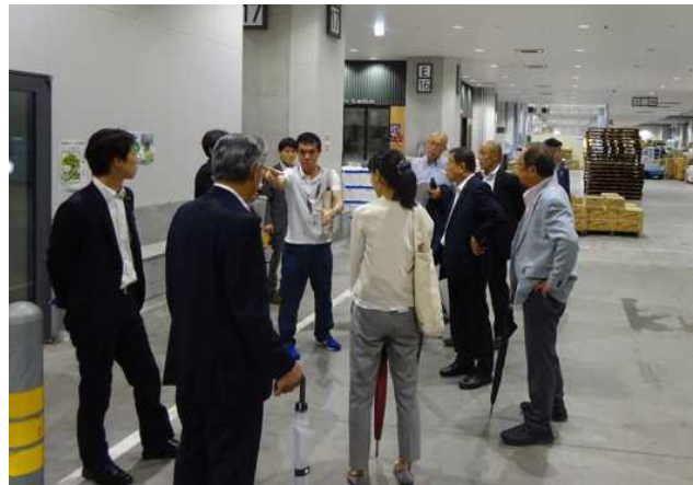
豊洲市場 視察の様子②