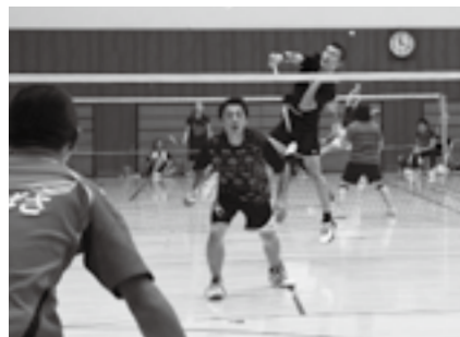
スマッシュを決める