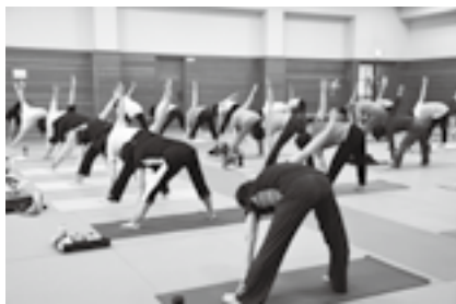
ゆっくりとポーズをとる

※申し込みは12月18日(火)午前9時から大栄B&G海洋センター(☎73-5110、月曜日、12月25日(火)は休館)へ。