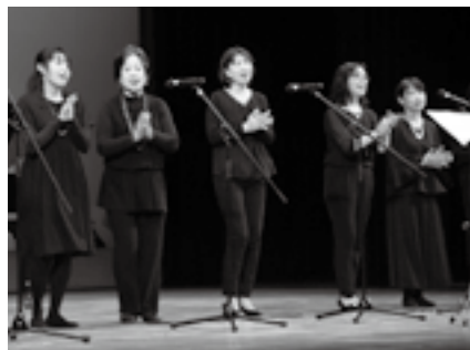
仲間とゴスペルを披露