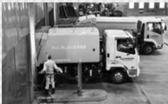
成田富里いずみ清掃工場にごみを搬入するトラック