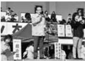
POPランの開会式であいさつ(11日)

本政策金融公庫から次のいずれかの資金融資を受けた事業者(小規模事業者経営改善資金)マール経融資)